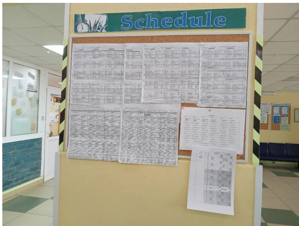
Рисунок. 3 – Стенд с расписанием уроков