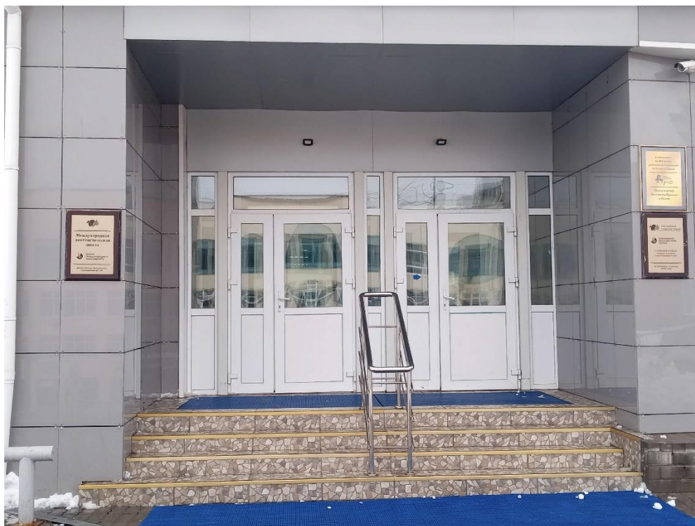
Рисунок. 1 – Здание школы

Здание школы отремонтировано, фасад сделан в современном стиле, на здании школы ввешены яркие баннеры.