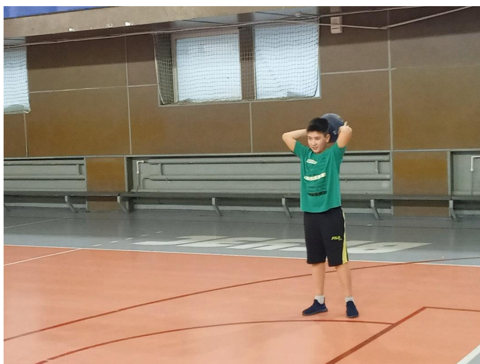
Рисунок. 5 – Спортивный зал

В школе есть большой спортивный зал, оборудованный всеми необходимыми спортивными объектами: баскетбольные кольца, волейбольная сетка, мячи, скакалки, скамейки и т. д. На пол нанесено специальное спортивное резиновое покрытие и разметка для игровых видов спорта.