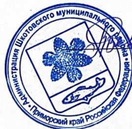
График согласован Руководитель аппарата администрации