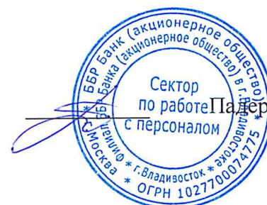
График согласован: Руководитель практики от предприятия — Филиала ББР Банка (АО), г. Владивосток. начальник сектора по работе с персоналом