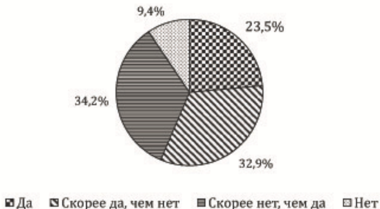
Рис. 1. Процентное соотношение мнений школьников о престижности работы учителя в РФ

Респондентам был задан вопрос о престижности профессии «учитель» в Российской Федерации на сегодняшний день. На основе полученных данных была составлена диаграмма, отражающая процентное соотношение мнений школьников о престижности работы учителя в Российской Федерации. Таким образом, современные ученики школ Приморья (56,4%) считают, что профессия «учитель» является престижной в нашей стране, остальные 43,6% таковой данную профессию не считают. С получившейся диаграммой можно ознакомиться ниже (рис. 1).