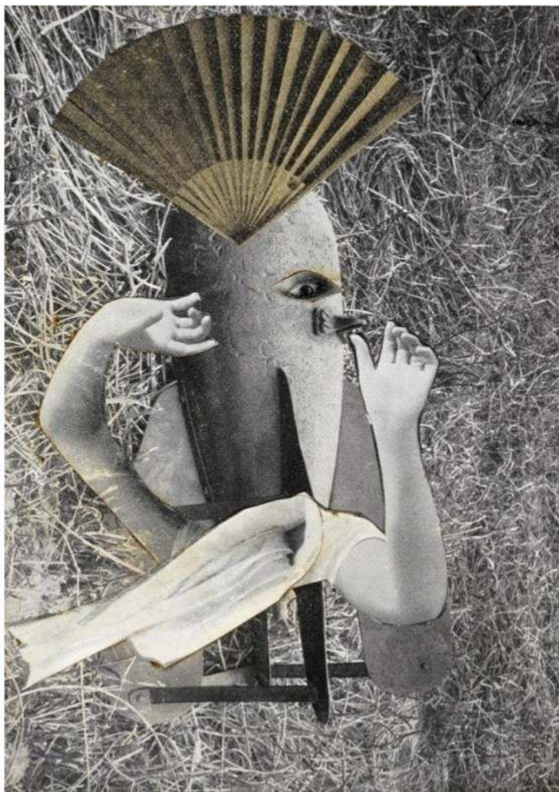
Рисунок 2 – Макс Эрнст «Китайский соловей»

Сюрреализм связано с последствиями сбоев и неожиданных вещей. Китайский соловей смешивает сознание и бессознательное (Рисунок 2).