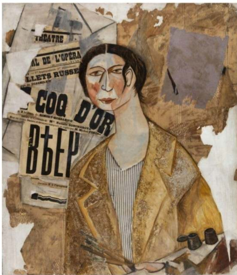
Рисунок 1 – Михаил Ларионов «Портрет Н.С. Гончаровой»

Ларионов создал множество портретов Натальи Гончаровой. Это произведение - своеобразный «парадный портрет» эпохи футуризма. Художник не столько пишет, сколько «делает» его из разных материалов – ткани, краски, кожи, фрагментов театральных афиш, опилок, превращенных в какие-то золотые крошки, и волос, возможно, пожертвованных самой Гончаровой (Рисунок 1).