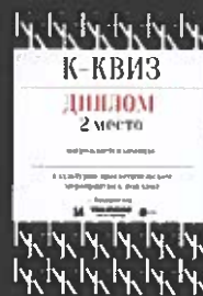
Диплом 2 место