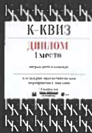
Диплом 1 место