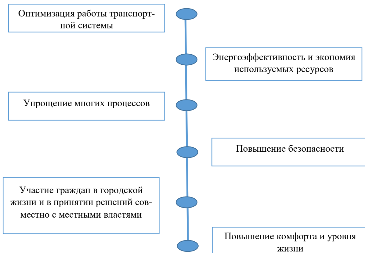
Рисунок 1.1 – Результаты получаемы в ходе использования Smart-технологий

ИКТ используются для повышения качества, производительности и интерактивности городских служб, снижения расходов и потребления ресурсов, улучшения связи между городскими жителями и государством. Процесс урбанизации не остановить, поэтому нужно обеспечить комфорт и безопасность. Какие преимущества у умного управления городом и почему Smart-технологии нужны человечеству, рассмотрим на рисунке 1.1