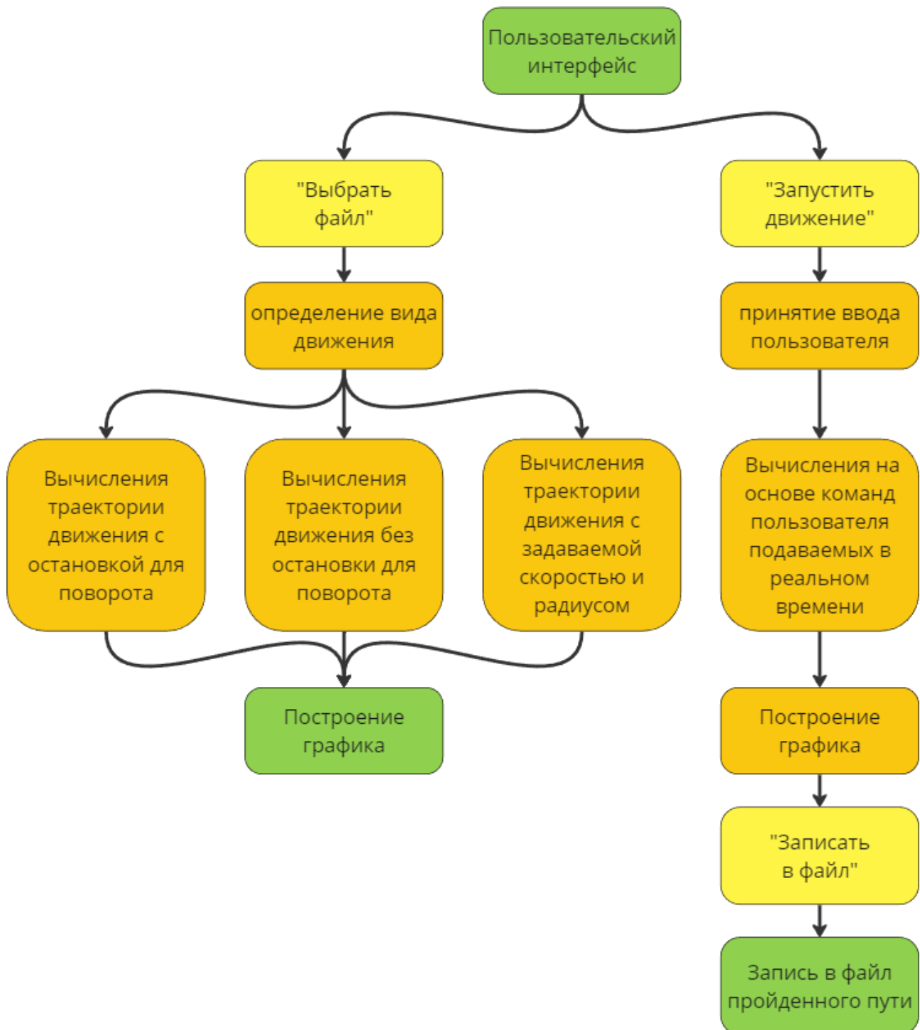
Рис.2. Архитектура программы

Вторая часть задачи была разделена на 3 этапа по возрастанию сложности создания соответствующей программы. В первую очередь было реализовано перемещение от точки к точке, с остановками, при фиксированных скорости и радиусе поворота. Следующим шагом являлась поддержка безостановочного перемещения, при фиксированных скорости и радиусе поворота. Последним этапом является перемещение, при котором скорость и радиус поворота изменяются в зависимости от конфигурации траектории. Программа считывает данные необходимые для движения из файла, определяет выбранный тип движения, затем производит расчет траектории и подает команды движения роботу. Архитектура программы изображена на рисунке 2.