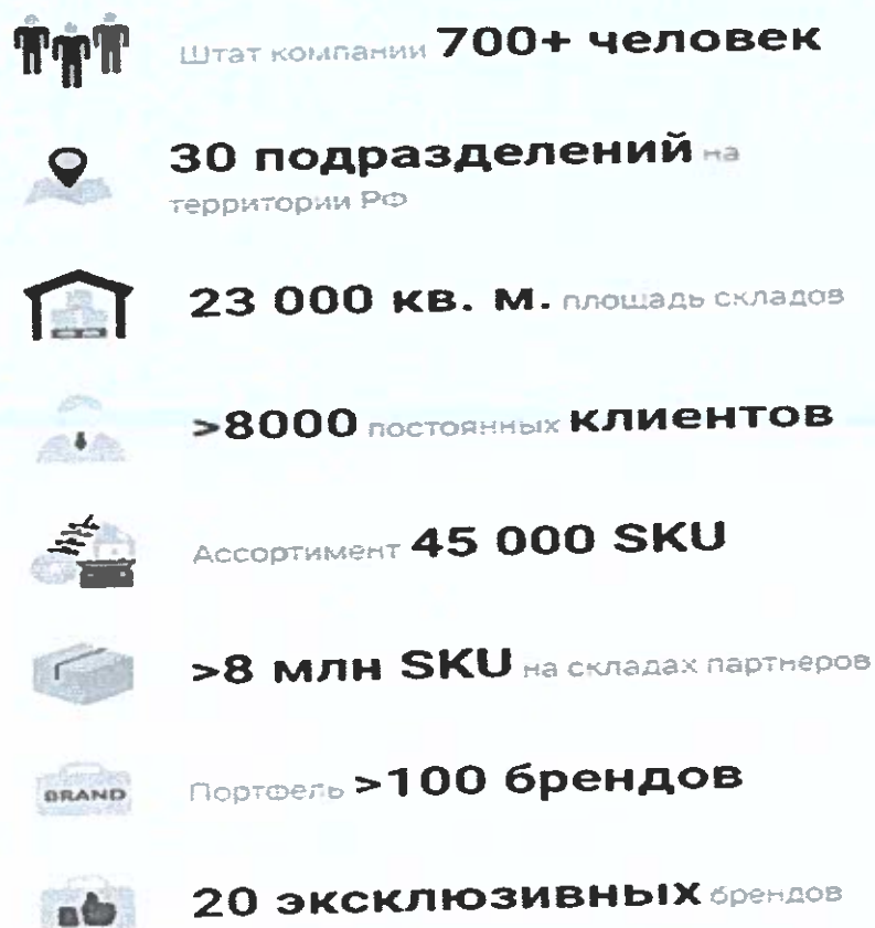
Рисунок 2 – Визуализация масштаба деятельности ООО «ГК Юником» в 2024 г

Эксклюзивные бренды являются визитной карточкой компании, многие производители полностью доверили «ГК Юником» продвижение и дистрибуцию своих брендов на территории РФ и стран СНГ. В результате многолетнего сотрудничества эта продукция заняла лидирующие позиции на рынке РФ, а для большинства производителей эксклюзивных брендов «Юником» теперь является крупнейшим зарубежным клиентом-дистрибьютором таких известных производителей, как Koito, The Furukawa Battery, NHK, Nitto, Kangaroo, Soft99, TCL, Eikosha и входит в топ – 3 крупнейших клиентов Advics.