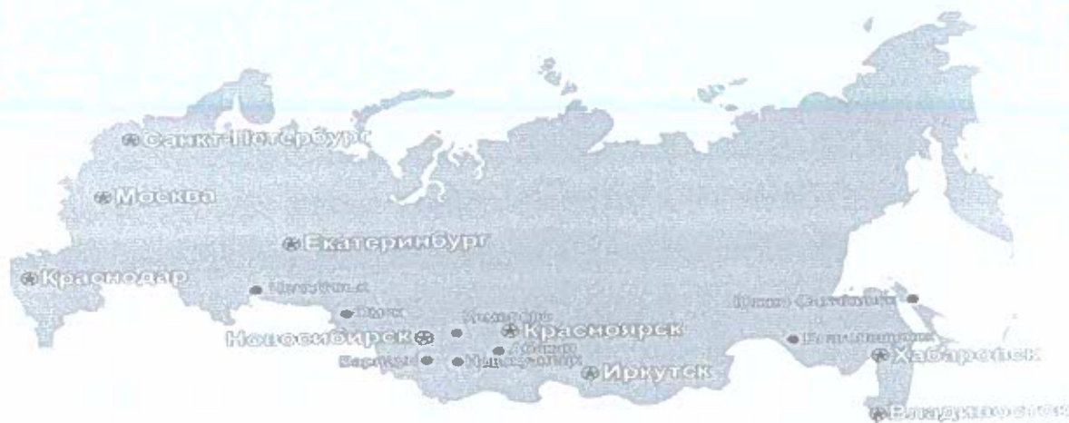
Рисунок 1 – Месторасположение филиалов и представительств «ГК Юникон» по РФ

Сеть филиалов компании (10 филиалов и 7 представительств) обеспечивает поставки качественной продукции и удобные сервисы клиентам - рисунок 1.