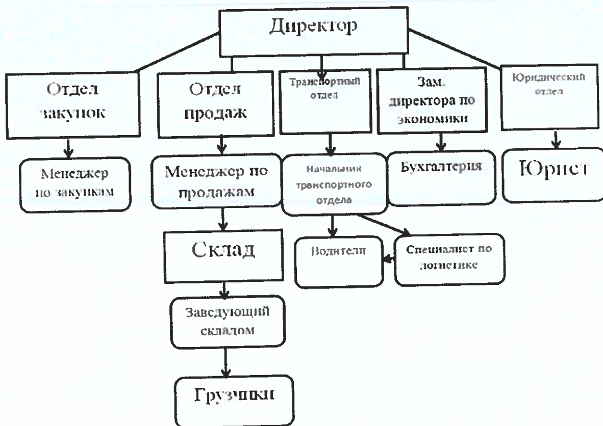
Рисунок 3 – Организационная структура ООО «ГК Юником»

Структуру управления можно разделить на три уровня: