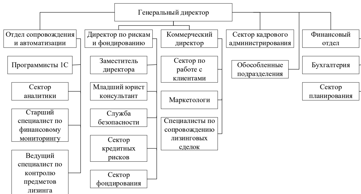
Рис 1.1. - Организационная структура ООО «ТаймЛизинг»

Основные показатели финансово-хозяйственной деятельности Общества приведены в таблицы 1.1.