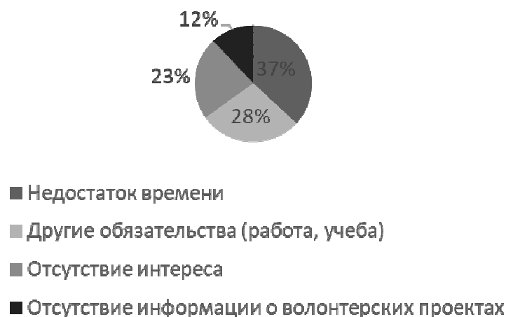
Рис. 2. Ответы респондентов на вопрос «Какие факторы, по вашему мнению, препятствуют более активному участию молодежи в волонтерстве?»

Наибольшее количество голосов набрал пункт «недостаток времени» (37%). Это свидетельствует о том, что молодые люди загружены учебой, работой или другими делами, и им сложно найти время для участия в добровольческих акциях. Следующим по значимости стал ответ «другие обязательства (работа, учёба)» – его выбрали 28% респондентов. Третьим по важности фактором стало отсутствие интереса (23%), что может быть связано с недостаточной популяризацией волонтерского движения или непониманием его ценности. Наименьшее число опрошенных (12%) столкнулись с проблемой недостатка информации о волонтерских проектах, что говорит о сравнительно хорошем уровне информированности, но одновременно выявляет необходимость усиления маркетинговой и разъяснительной работы. Одним из вопросов было выявление основных проблем в организации волонтерских мероприятий. Респондентам предлагалось выбрать наиболее значимые трудности, с которыми они сталкивались или о которых знали. Среди всех вариантов недостаток ресурсов был отмечен наибольшим числом участников — 39%. Этот ответ включает нехватку финансирования, оборудования, транспорта, инвентаря и квалифицированных кадров, необходимых для эффективного проведения мероприятий. Вторым по популярности стал недостаток координации между участниками (31%), что свидетельствует о проблемах в коммуникации, планировании, распределении обязанностей и взаимодействии между волонтерами, организаторами и партнерами.