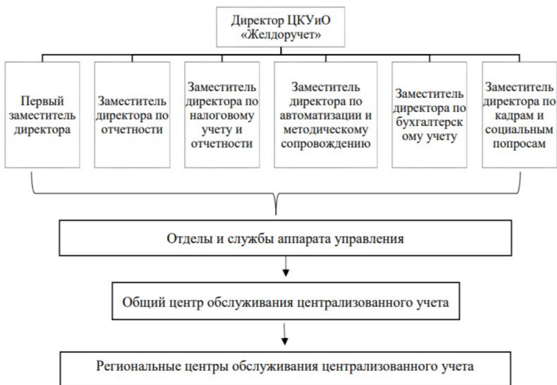
Рисунок 1.1 Организационная структура АО «Желдоручет»

Центр корпоративного учета и отчетности «Желдоручет» имеет вертикально выстроенную структуру, которая состоит из отделов и секторов различных направлений деятельности, кроме того, в структуре присутствуют два управления.