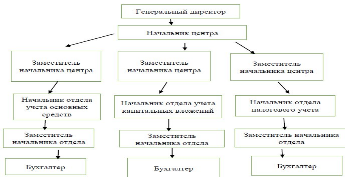
Рисунок 1.2 – Организационная структура филиала АО «Желдоручет» во Владивостоке

Далее рассмотрим организационную структуру филиала АО «Желдоручет» во Владивостоке (рисунок 1.2).