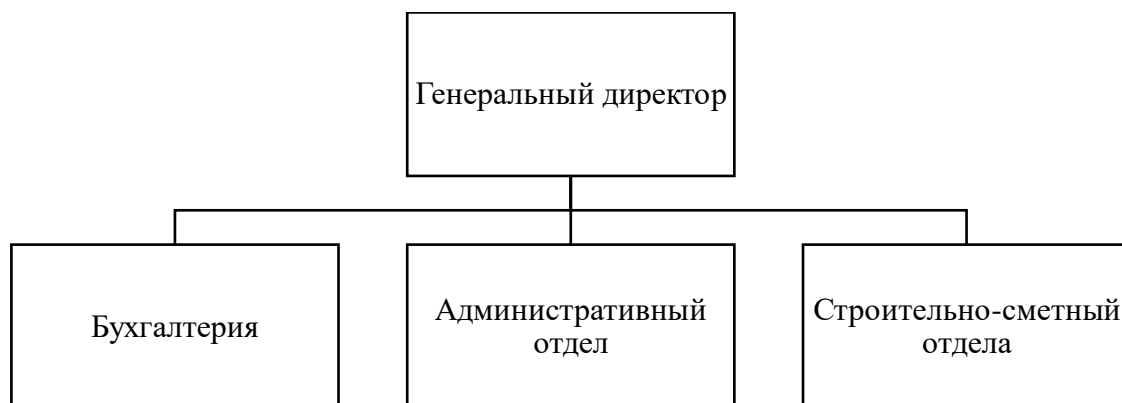
Рисунок 1.1 – Организационная структура ООО «ЮВК»

Организационная структура ООО «ЮВК» (рисунок 1.1)