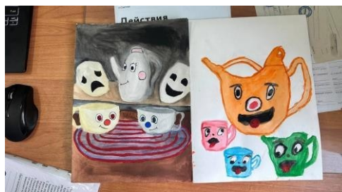
Рисунок 7 - пример рисунков детей 7 класса по теме «Единство функционального и эстетического в дизайне. Вещь как художественно-материальный образ времени»