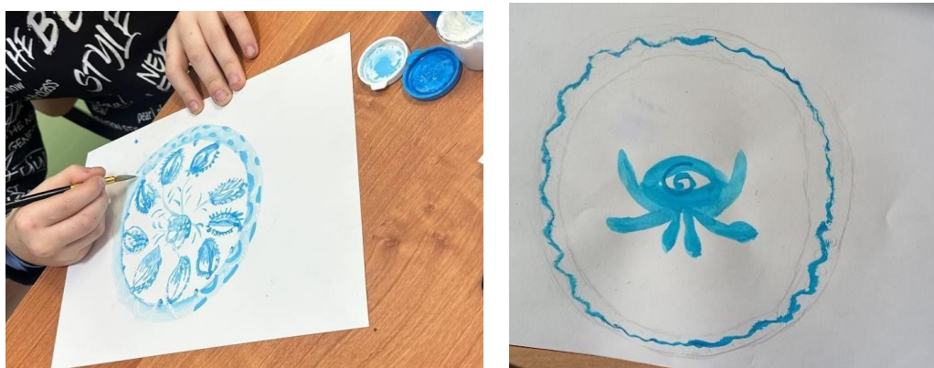
Рисунок 2 – пример рисунков детей 5 класса по теме «Искусство Гжели. Посуда из глины: единство скульптурной формы и росписи»

доступность восприятия сложного материала. Такой подход позволил структурировать творческую задачу, разбив ее на последовательные и понятные этапы, что особенно важно для пятиклассников. Практическая работа, основанная на освоении «азбуки» Гжели, носила репродуктивно-творческий характер, позволяя учащимся, с одной стороны, отработать технические навыки кистевого письма, а с другой — проявить самостоятельность в компоновке элементов в целостную композицию. Организация итоговой выставки на общем столе и презентация работ каждым учеником способствовали формированию чувства значимости личного труда, развитию коммуникативных навыков и созданию атмосферы общего успеха. Вопросы, заданные в ходе рефлексии, были сформулированы таким образом, чтобы вывести учащихся за рамки технического исполнения и побудить их к эстетической и культурологической оценке явления. Ответы на вопросы о «самом трудном», о новом взгляде на искусство и о его долговечности показали, что учащиеся не просто освоили набор приемов, но и задумались о ценности и смысле традиционного искусства. Таким образом, задачи урока - познавательная, развивающая и воспитательная- были решены.