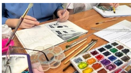
Рисунок 6 - пример рисунков детей 7 класса по теме «Важнейшие архитектурные элементы здания. Анализ структурных элементов здания»

Проведённое занятие успешно достигло поставленной цели. Ученики получили чёткое понимание, что каждый архитектурный элемент - важная часть конструкции, несущая определённую нагрузку.