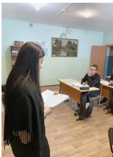
Рисунок 9 – проведение урока в 9 классе на тему «Закономерности наследования признаков, установленные Г. Менделем. Моногибридное скрещивание»

Ребята имели некие сложности в решении задач, но это было из-за паники, так как они боялись ошибиться и тяжело было понять содержание одной из задачи