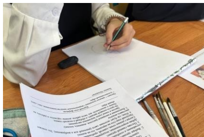
Рисунок 4 - пример рисунков детей 6 класса по теме «Выразительные возможности натюрморта. Художественный образ в натюрмортах - картинах известных художников.

Проведённое занятие успешно достигло поставленной цели, позволив учащимся не просто закрепить знания о жанре, а увидеть натюрморт как мощное средство художественного высказывания. Практическая работа, сфокусированная на композиционном проектировании, дала им возможность на собственном опыте почувствовать себя творцами, выбирающими каждый предмет и его место ради воплощения замысла. Урок стал важным шагом в формировании у школьников способности видеть смысловую глубину простых вещей.