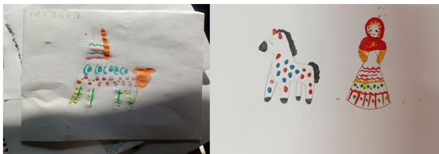
Рисунок 1 – пример рисунков детей 5 класса по теме «Древние образы в игрушках народных промыслов»

искусства и создания собственных осмысленных работ. С методической точки зрения, следует отметить удачное сочетание форм работы: эвристическая беседа, наглядный анализ, лекция-расшифровка, творческая практика и презентация с рефлексией. Для оптимизации временных затрат в будущем можно подготовить более разнообразные шаблоны-силуэты для тех, кто испытывает сложности с рисунком, что позволит больше времени уделить именно символической росписи. В целом, урок способствовал формированию уважительного и вдумчивого отношения к культурному наследию, развил образное мышление и навыки декоративной композиции.