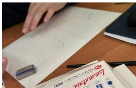
Рисунок 8 - пример рисунков детей 7 класса по теме «Дизайн - искусство формообразования. Взаимосвязь формы и материала в дизайн-проектировании»

Проведённое занятие успешно достигло поставленной цели, позволив учащимся увидеть в дизайне не произвол фантазии, а глубоко осмысленную дисциплину формообразования.