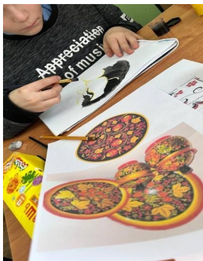
Рисунок 3 – пример рисунков детей 5 класса по теме «Золотая Хохлома. Приемы росписи травного орнамента»

Урок достиг своей главной цели, превратив знакомство с Золотой Хохломой из простого изучения темы в эмоциональное открытие одного из символов национальной культурной идентичности.