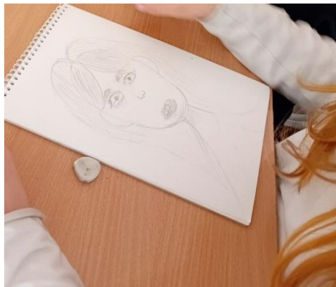
Рисунок 5 - пример рисунков детей 6 класса по теме «Образ человека - главная тема в искусстве. Портретное изображение в истории искусства. Виды портрета»

Практическая работа, сфокусированная на освоении базовых пропорций, дала им необходимый инструментарий для дальнейших творческих поисков, показав, что даже самый выразительный образ строится на знании канона. Таким образом, урок стал важным шагом в формировании у школьников способности «читать» портрет как сложный исторический и культурный текст и понимать фундаментальные принципы создания художественного образа человека.