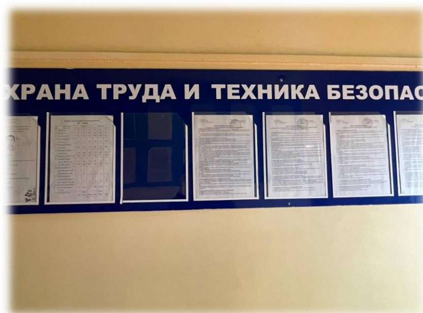
Рисунок. 7 – Информационный стенд о технике безопасности и охране труда