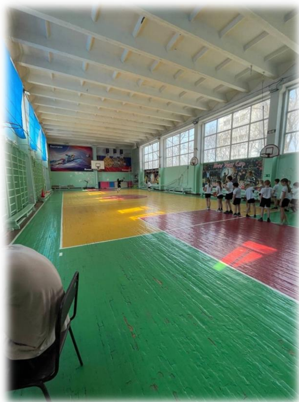
Рисунок. 4 – Спортивные зала