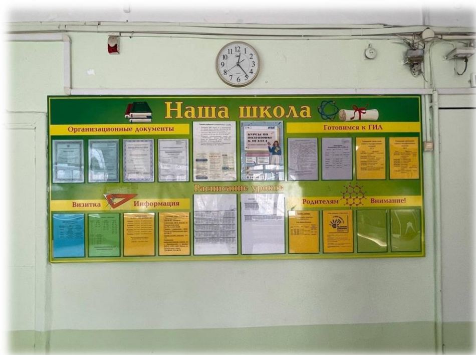
Рисунок.3 – Информационный стенд