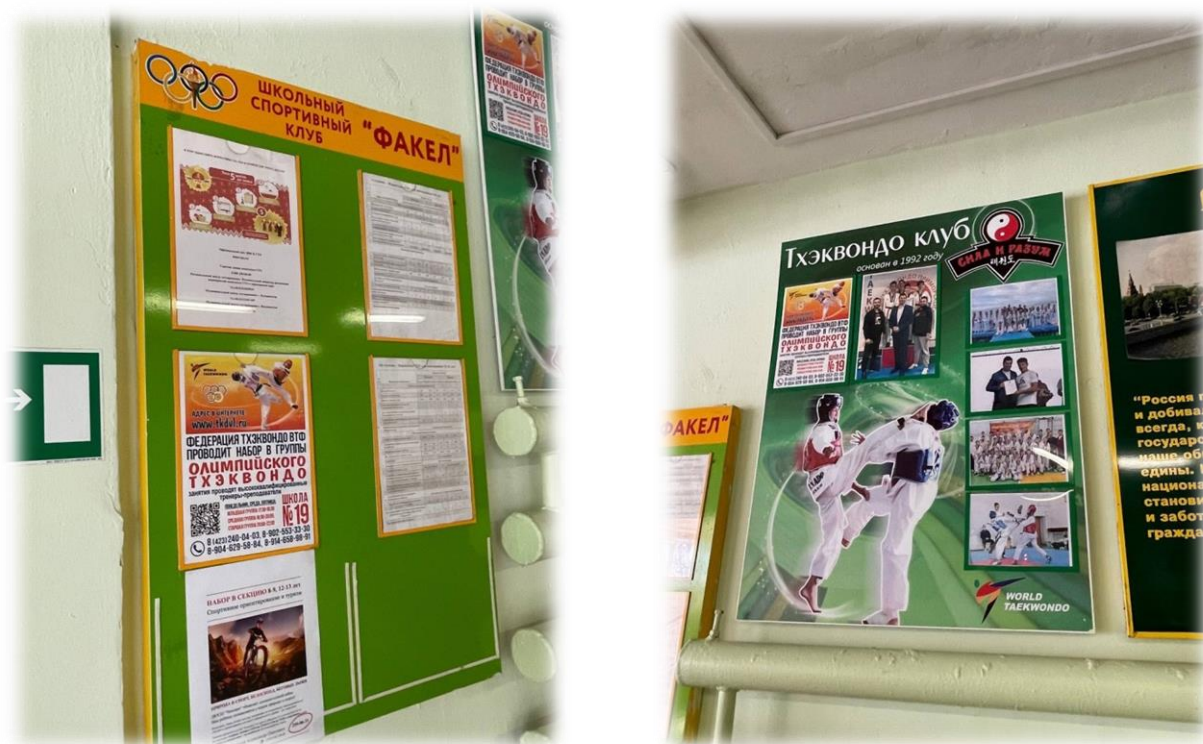
Рисунок. 6 – Расписание внеурочных занятий по физической культуре, информация о школьном спортивном клубе «Факел», а так же тхэквондо клубе