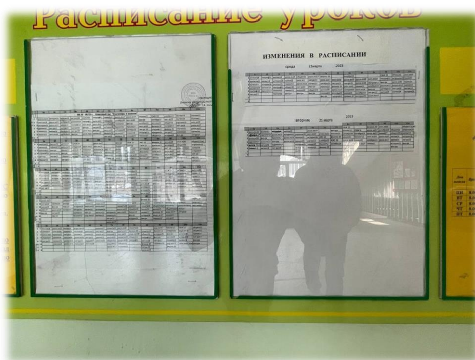
Рисунок. 2 – Стенд с расписанием уроков

Здание школы отремонтировано, на здании школы вывешен флаг РФ