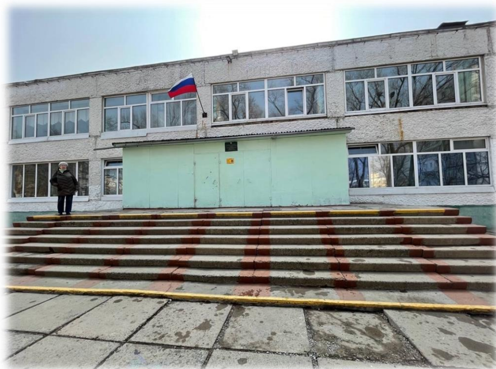
Рисунок. 1 – Здание школы

Здание школы отремонтировано, на здании школы вывешен флаг РФ