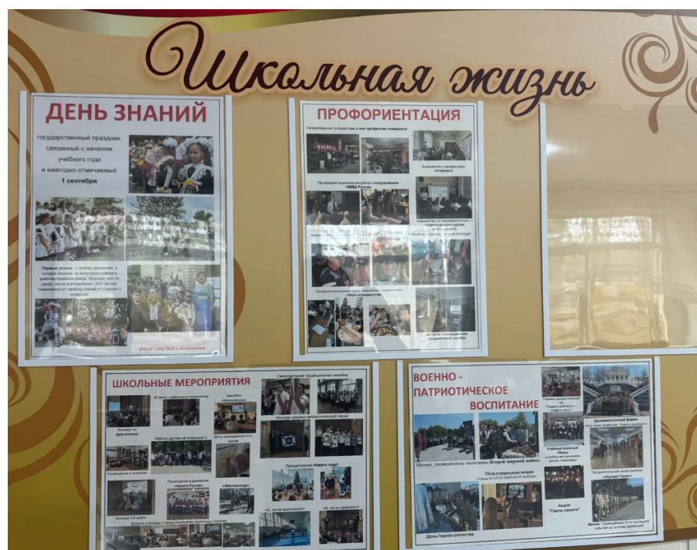
Рисунок А.7 - Прохождения школьных мероприятий. МБОУ СОШ №3 с. Астраханка