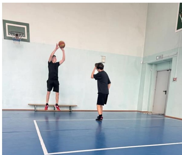
Рисунок В.2- Бросок мяча в кольцо