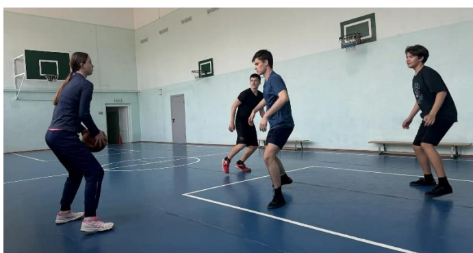
Рисунок В.5- Передача мяча