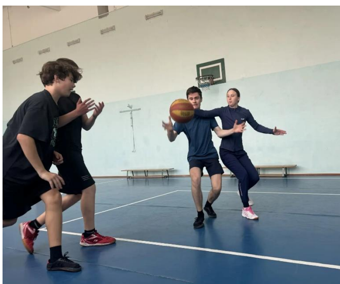
Рисунок В.3- Защита соперника