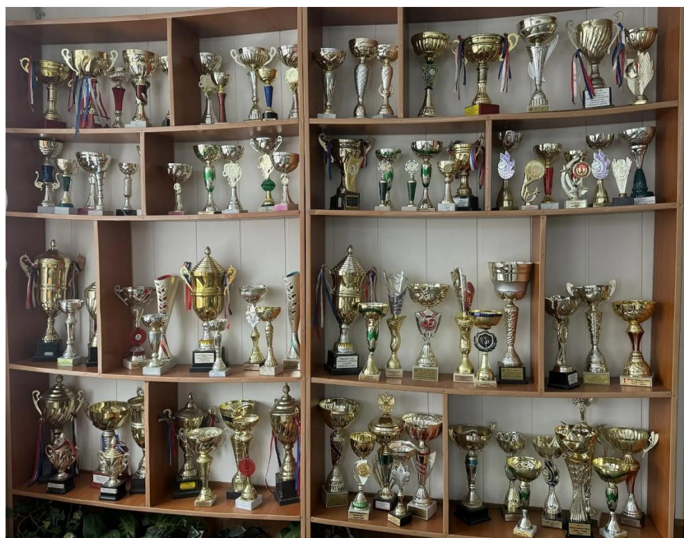
Рисунок А.6 – Стенд с наградами. МБОУ СОШ №3 с. Астраханка