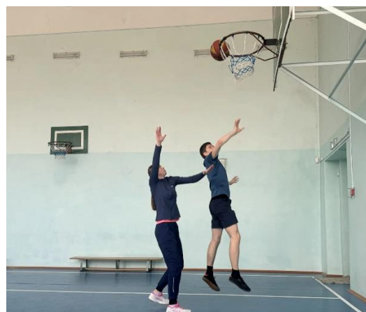
Рисунок В.6- Защита мяча из под кольца