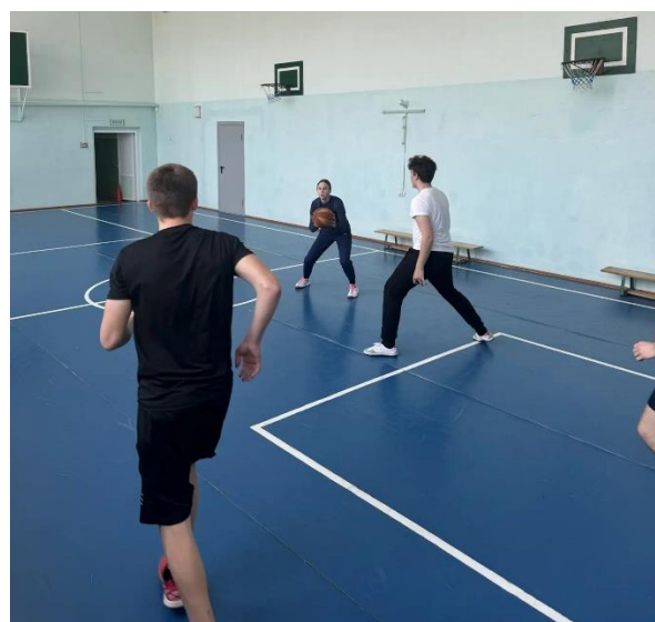
Рисунок В.4- Выведение мяча из зоны