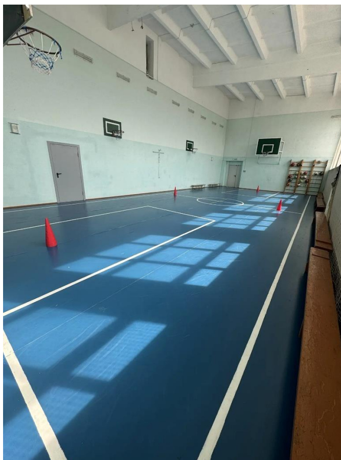
Рисунок А.2- Спортивный зал. МБОУ СОШ №3 с. Астраханка