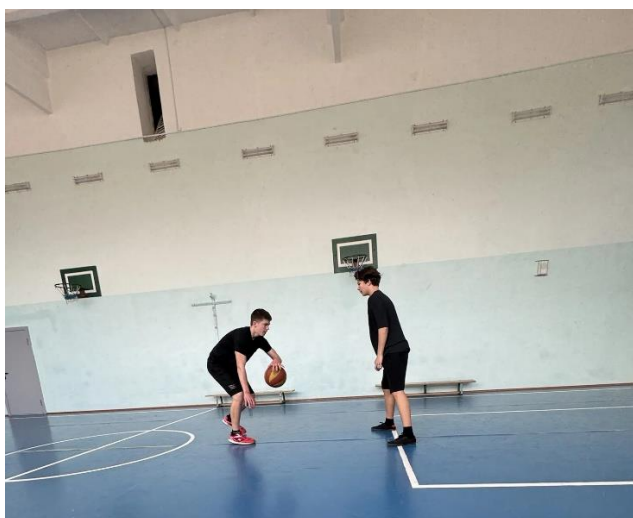
Рисунок В.1 - Введение мяча через соперника

Фотоматериалы процесса внедрения разработанных методических материалов