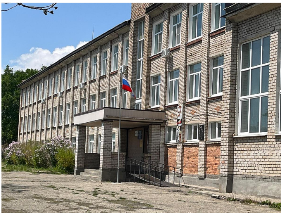
Рисунок А.1 – Фасад здания. МБОУ СОШ №3 с. Астраханка