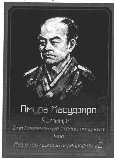
Рис.1. Портрет Омура Масудзиро в авторской настольной симуляционной модели Войны Босин

на основе обязательного массового призыва», оказали сильное влияние на прогрессивную часть военного руководства. Согласно изданным 20 октября 1869 г. «Правилам призыва на военную службу» – «Тёхэй кисоку», призыву подлежали лица, достигшие 20 лет. Эта реформа имела колоссальное внешнеполитическое значение: массовая армия западного образца стала основой для будущей японской экспансии в Корею и Китае, изменив баланс сил в регионе. М.М. Рябова и А.В. Ефремов подчёркивают, что индустриализация, осуществлявшаяся в рамках политики «богатая страна – сильная армия» (фукоку кёхэй), стала системообразующим элементом военной модернизации Японии периода Мэйдзи [1, с. 270].