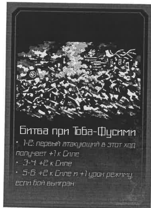
Рис. 6. Битва при Тоба-Фусими в авторской настольной симуляционной модели Войны Босин

Одно из ключевых событий в рамках настольной игры «Война Босин» – битва при Тоба-Фусими (рис. 2). Эта битва стала переломным моментом, после которого региональный баланс сил безвозвратно изменился. Д.Д. Романчев подробно реконструирует ход событий: катализатором открытой эскалации послужил марш войск бакуфу на Киото; формальным поводом для выдвижения стала попытка доставки петиции Токугавы Ёсинобу, изобличающей интриги фракции Сацума и дворцовой группировки Ивакура Томоми [6, с. 39]. Армия сёгуната, насчитывавшая 15 000 человек, превосходила силы Сацумы и Тёсю в соотношении 3 к 1. В их рядах были как наёмники, так и отряды, прошедшие подготовку под руководством французских военных советников, например Дэнсютай [6, с. 39]. Как отмечает С. Наумов, французские советники уделяли особое внимание пересмотру системы физической подготовки японских солдат, а пособия и программы, привезённые в Японию, позднее стали вводиться как в военных, так и в гражданских образовательных учреждениях [9, с. 40]. Передовые войска бакуфу (правительства сёгуна) были вооружены устаревшим оружием, таким как пики и мечи. Несмотря на численное превосходство противника, силы княжеств Тёсю и Сацума были полностью модернизированы и оснащены гаубицами Армстронга, винтовками Минье и даже пулемётом Гатлинга. Развернувшееся противостояние репрезентирует классическую проблему военной асимметрии: столкновение количественного превосходства с технологической инновацией.