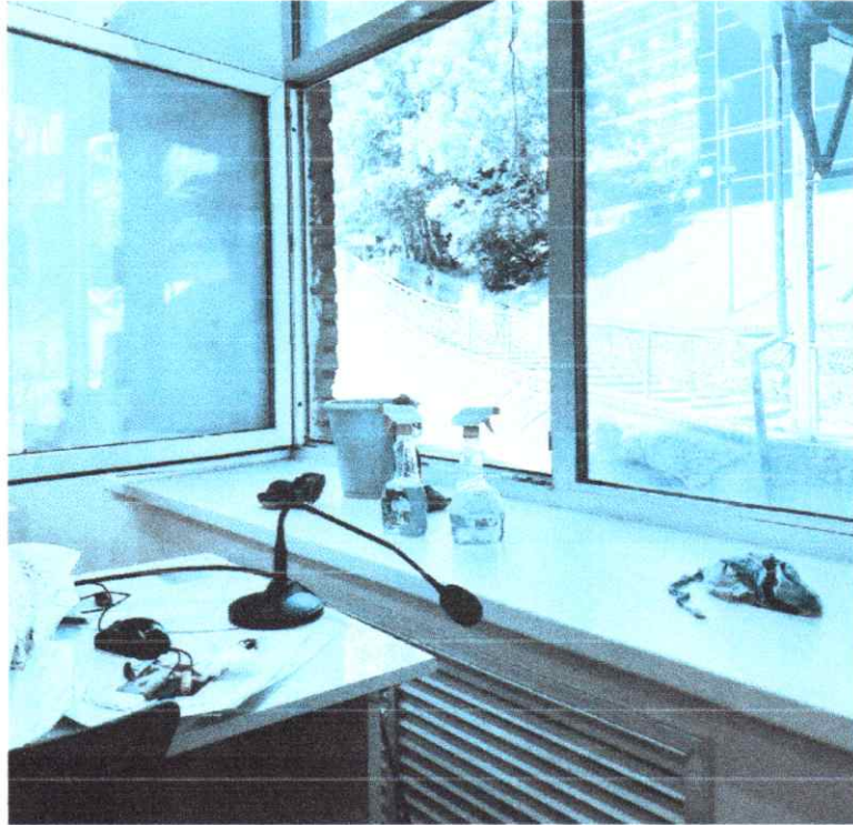
Рис 3 - Уборка на територии университета