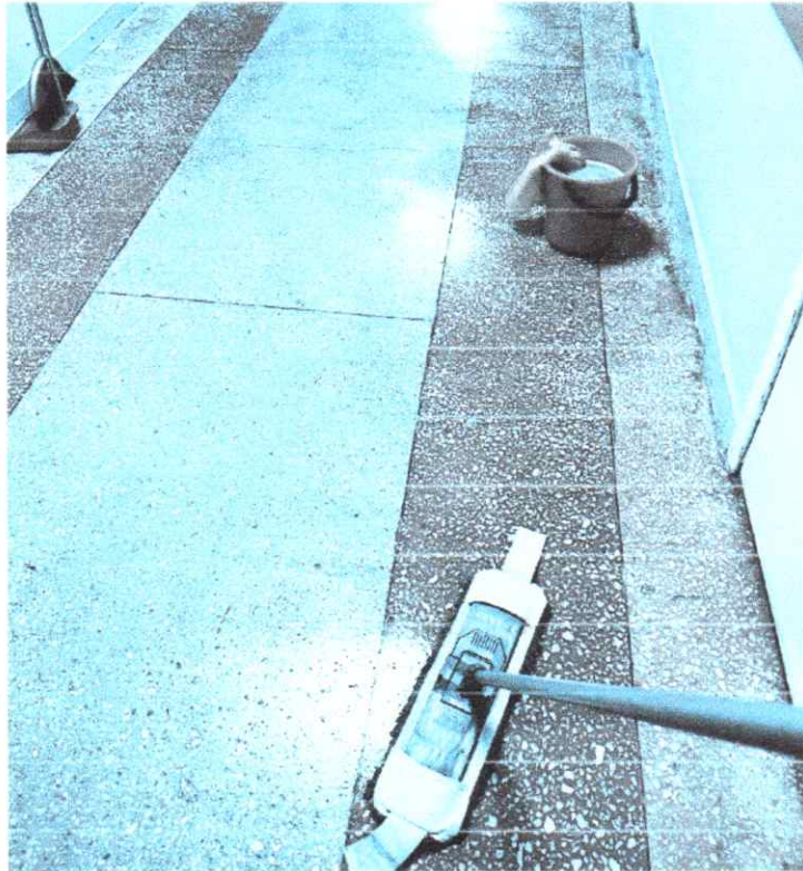
Рис 4 - Уборка на територии университета