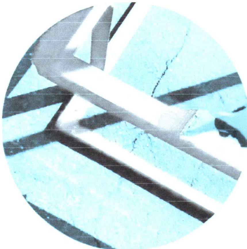
Рис 6 - Субботник