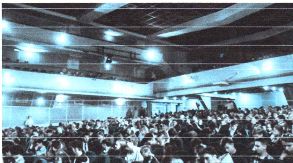
Рис 1- Посвящение в студенты