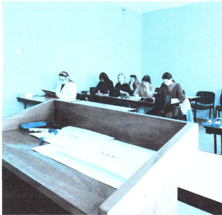
Рис 5 - Волонтерство в конкурсе "Юный дизайнер"