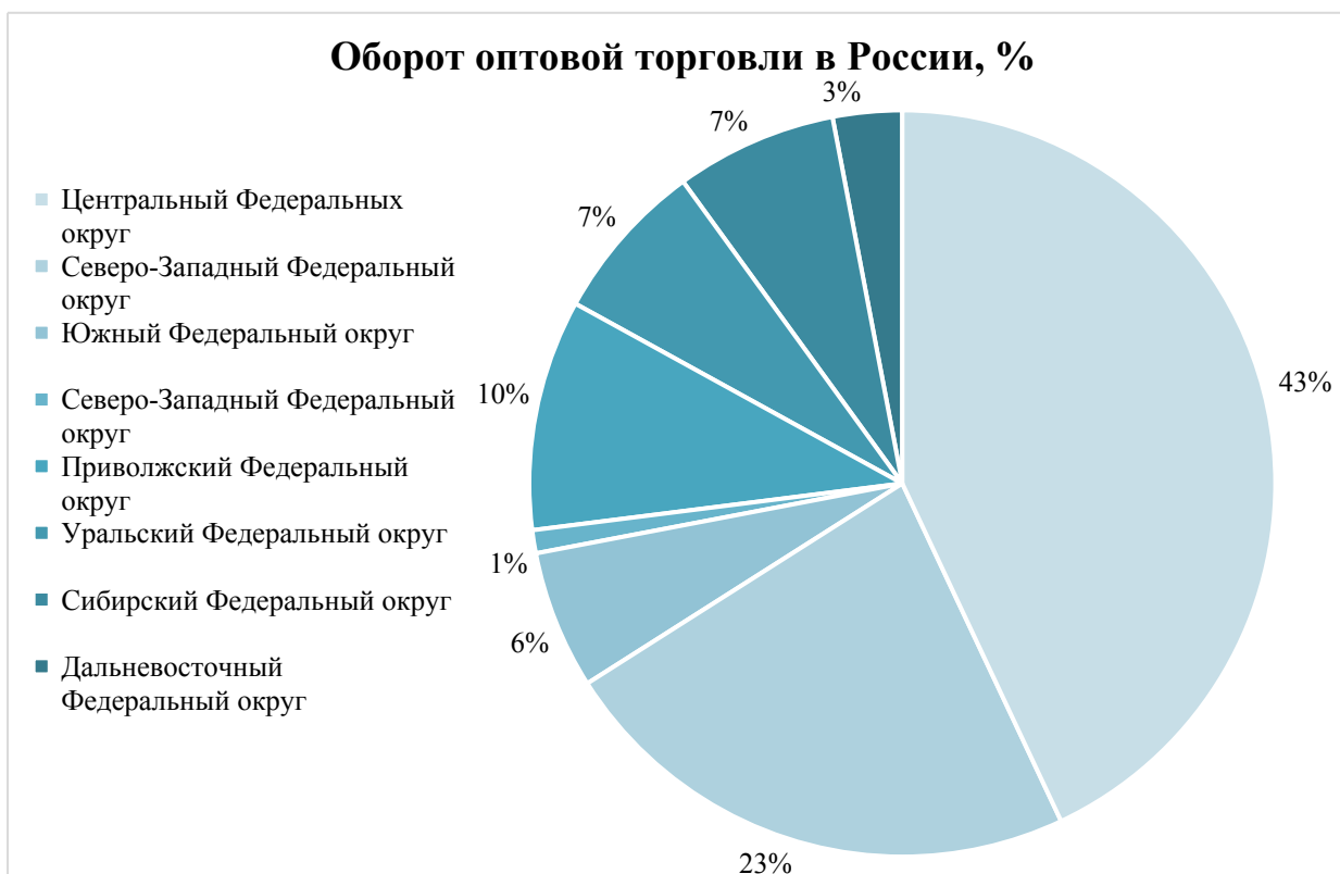
Рисунок 3.2 – Оборот оптовой торговли в России по регионам

На отрасль также имеют влияние социальные аспекты: