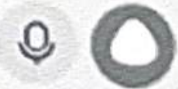
Рисунок А.2 – Диалог с нейросетью Алиса AI