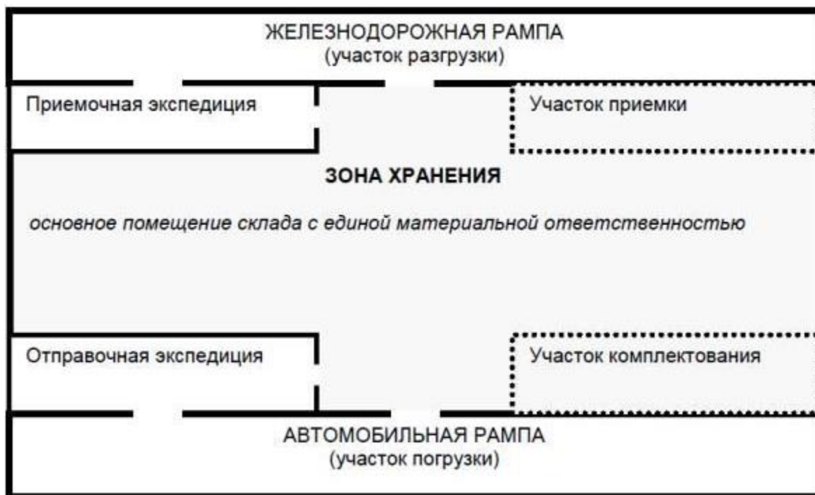
Рисунок 3 – Схема складского помещения

На рисунке 3 представлен принцип планировки складского помещения.