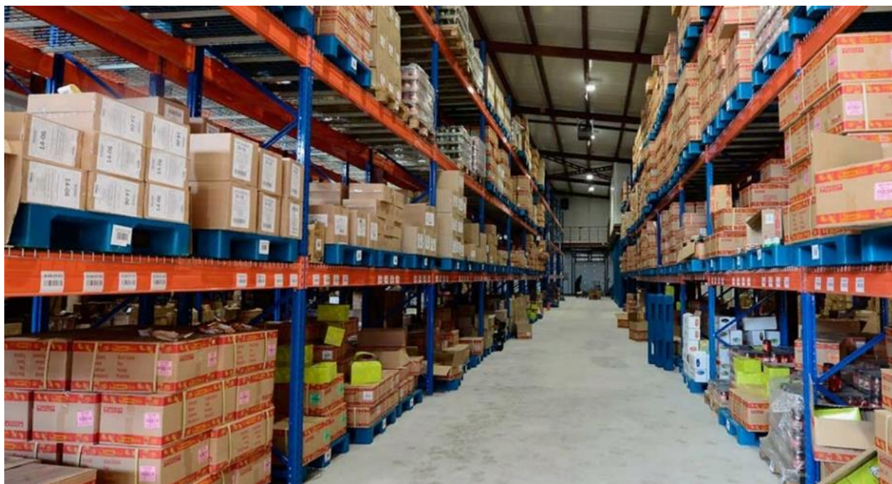
Рисунок 2 – Склад компании ООО «Транзит»

Развиваясь и улучшая клиентский сервис, компания «Транзит» в конце 2018 приобрела в собственность склад крытого типа класса «В+» для сборного груза, площадью 317 м 2 . Склад расположен в Подмосковье по адресу Коровинское Шоссе 35 стр. 4. На рисунке 2 представлен склад компании ООО «Транзит».