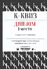
Диплом 1 место