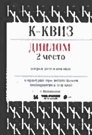
Диплом 2 место