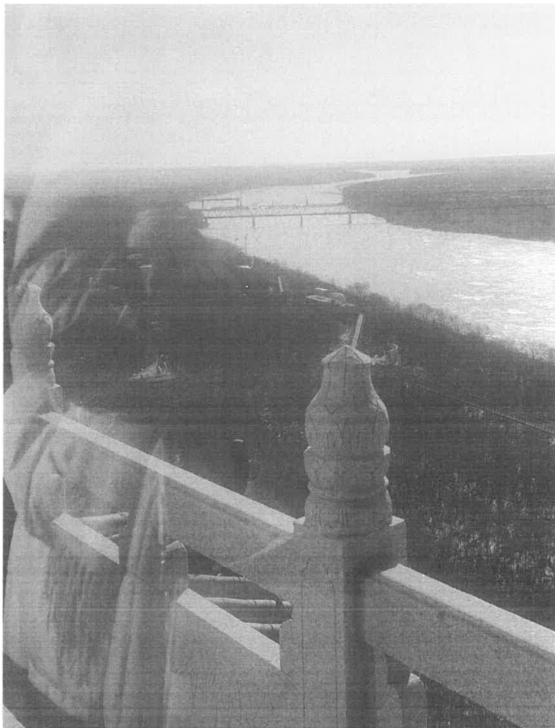
Рисунок А.1 - Панорама стыка трех границ (Россия, Китай, КНДР) со смотровой башни Лунху