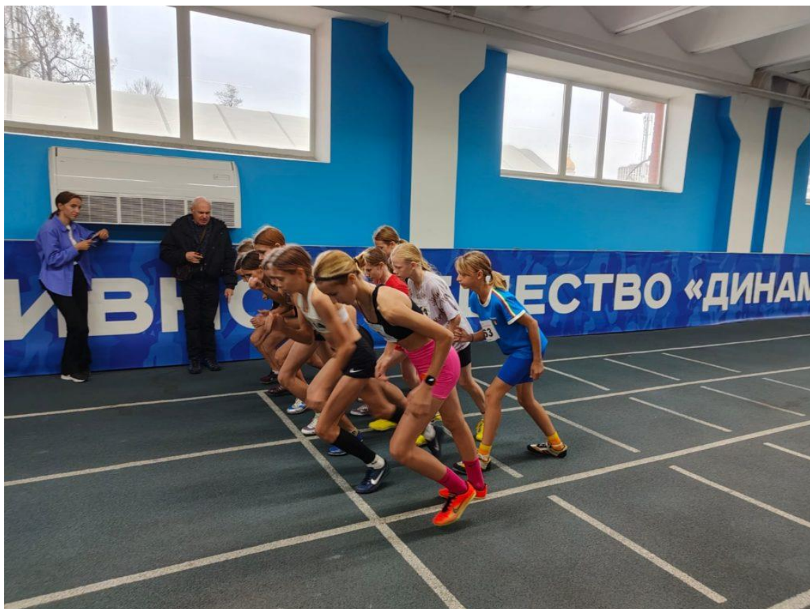
Рис.1-Бег на короткие дистанции среди девочек