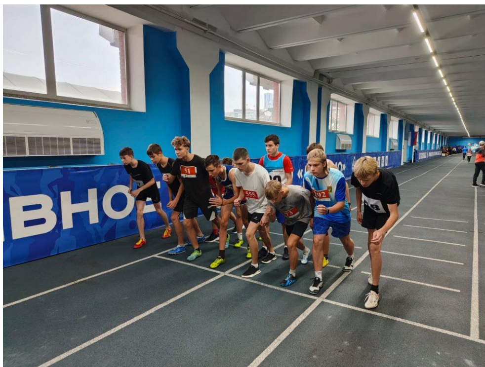
Рис.2- Бег на длинные дистанции среди мальчиков